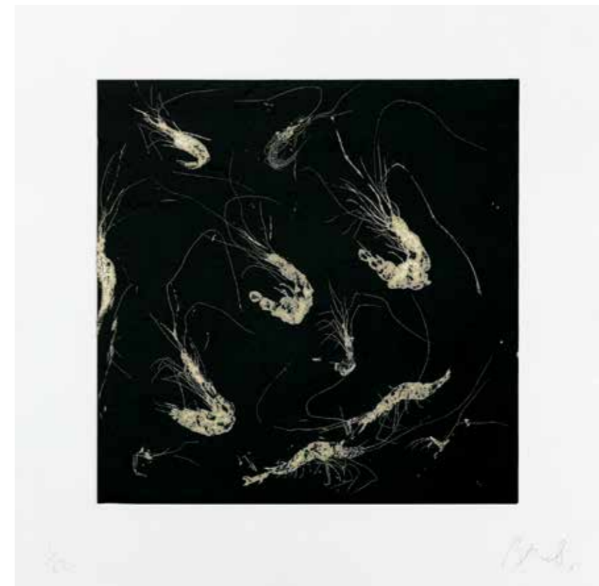
Dalt / top: Ánerie, 2010 - 2011. Gravats / Print. 2/22. 50,5 x 50 cm.