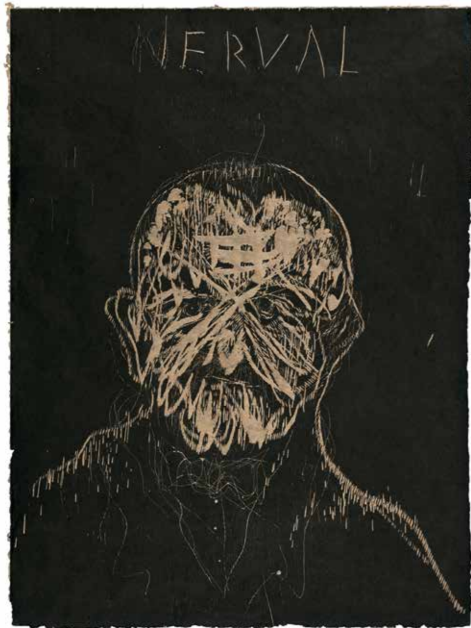
Gérard de Nerval. Série de l'letraferits , 2015. Xilografia / Woodcut. 1/12. 77 x 57 cm aprox.