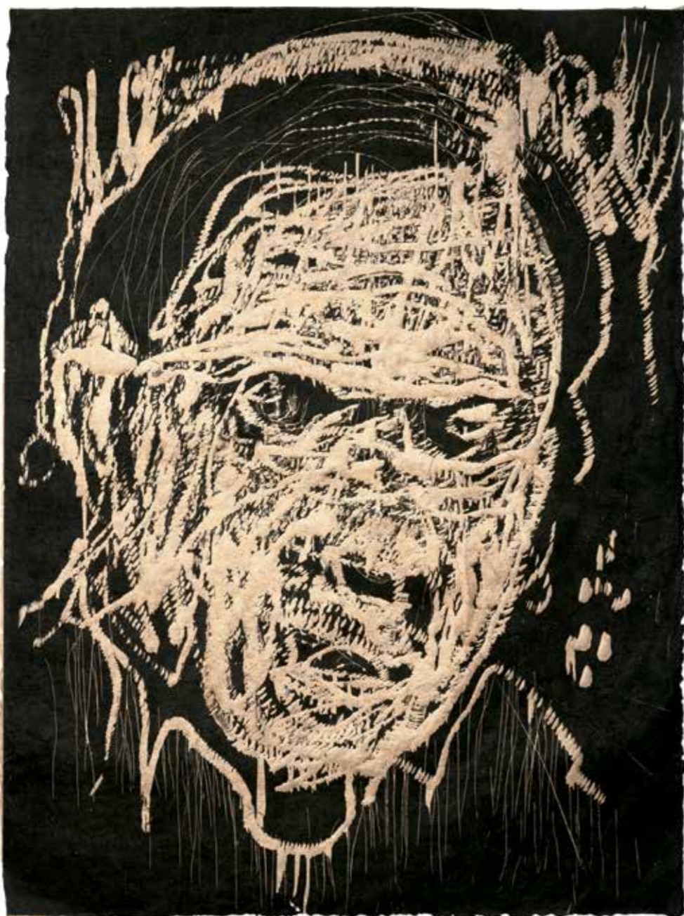
Miquel Bauçà. Sèrie de lletraferits , 2015. Xilografia / Woodcut. 1/12. 75 x 57 cm aprox. Fotografia / Photography: Charles Duprat.

organic and mineral elements such as seeds and mica, as well as unusual materials like Formica. Before collaborating with Barceló, Roma and Motomiya were already well known for their intense collaboration with Antoni Tàpies, with whom they worked for many years. They also collaborated with artists such as Perejaume, Guillermo Pérez Villalta, Barry Flanagan and Ramiro Fernández Saus. Roma and Motomiya are renowned for their extraordinary technical mastery, particularly their astonishing use of colour, achieving rich and unusual chromatic ranges.