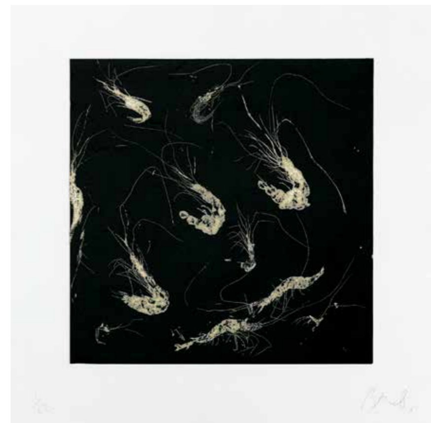
Arriba / top: Ánerie, 2010 - 2011. Grabado / Print. 2/22. 50,5 x 50 cm.