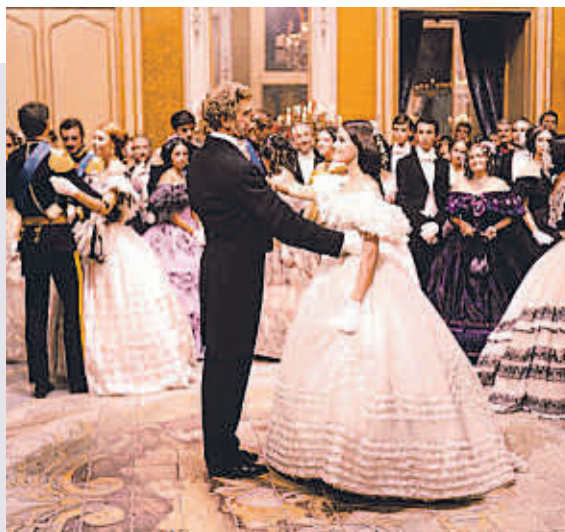
Fotograma d'El gattopardo' (1963) del director Luchino Visconti

Entre les suculentos pàgines plenes de jocs erudits i sexuals, em van divertir especialment les que dedica als seus intents per vendre un joc de porcel·lanes de Sèvres a Londres. Es reuneix amb experts i historiadors de l'art –“tractar amb els anglesos sempre fa goig: són cortesos i expeditius, i la seva aparent estupidesa és només immensa i irrefrenable timidesa”– que li aconsellen com vendre-la. És curiós veure com tots ells li desaconsellen que vagi als antiquaris perquè cobren les taxacions. Recalca la mala pràctica (comuna encara avui) de cobrar un percentatge de la taxació i d'aquesta manera inflar